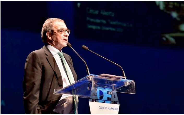
César Alierta, presidente de Telefónica