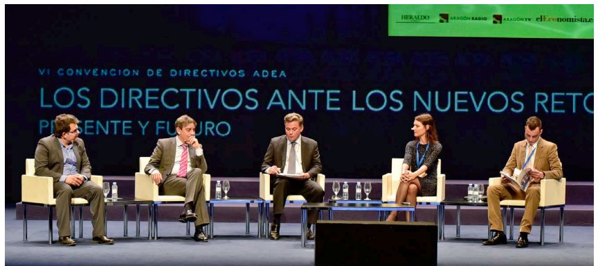
Mesa dedicada a las nuevas tecnologías, con directivos de Garagescanner, Exovite, Dolce Vita Tejo y Oryzon Genomics