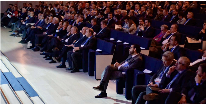
Asistentes a la Convención ADEA 2015