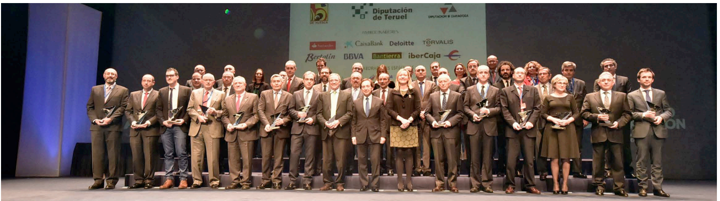
Premiados ADEA 2015