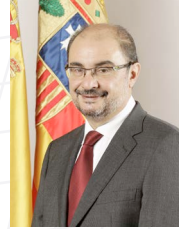
JAVIER LAMBÁN Presidente del Gobierno de Aragón