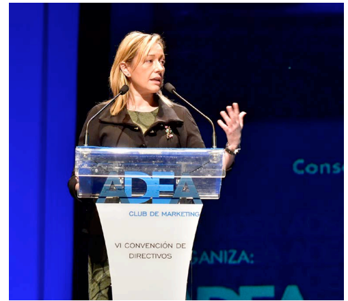
Marta Gastón, consejera de Economía, Industria y Empleo del Gobierno de Aragón